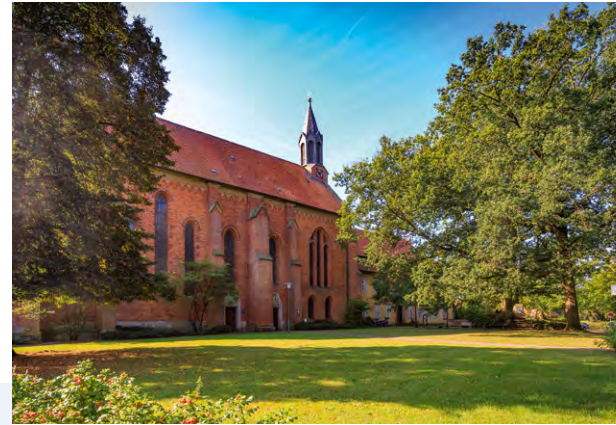
Das Kloster Mariensee

Auf dem Moorhenniespfad können Sie die kulturelle und landschaftliche Vielfalt in Poggenhagen und Neustadt allein oder mit der Familie entdecken. An insgesamt 31 Stationen lassen sich mit dem Smartphone über QR-Codes Zeitzeugen aufrufen, die in und mit dieser Landschaft leben. Die Routen teilen sich in Nord und Süd auf. Die Geschichte des Moorhennies spielt zwischen Moor und Leine zur Zeit des Dreißigjährigen Krieges. Mittelpunkt der Handlung ist der Moorkrug auf dem Südrundweg.