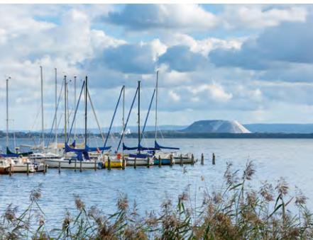
Blick auf den Kalimandscharo vom Nordufer in Mardorf