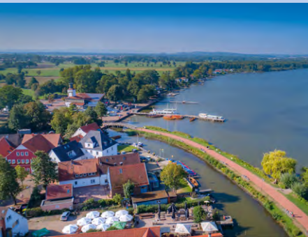
Uferpromenade in Steinhude

Am Nord- oder Südufer verbreitet sich maritimes Flair. Die Vielzahl kultureller Angebote und idyllischer Dörfer lädt zu außergewöhnlichen Ausflügen in die Umgebung ein. Auch wer schon seit vielen Jahren hier seinen Urlaub verbringt erlebt den Ort immer neu und je nach Jahreszeit ruhig und entspannt oder auch sportlich und aktiv. Wir zeigen Ihnen die schönsten Ecken und warum das Steinhuder Meer so einzigartig ist.