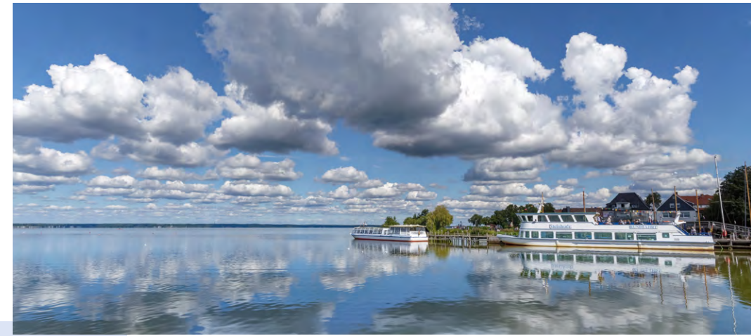
Fahrgastschiffe am Bootsanleger Strandterrassen in Steinhude

Der ebenfalls staatlich anerkannte Erholungsort liegt beschaulich an der Nordseite des Steinhuder Meeres. Entlang eines fünf Kilometer langen Uferweges zieht sich der kleine Ort mit seinen Restaurants, Bootsverleihen und Stegen für Segelboote durch eine wunderschöne Dünen- und Strandlandschaft. Der liebevoll restaurierte Ortskern mit seinen Fachwerk-Ensembles am Aloys-Bunge-Platz, der kleinen Kapelle und dem Heimatmuseum lädt zum Verweilen ein, bevor die Region per Fahrrad oder auch zu Fuß erkundet werden kann.