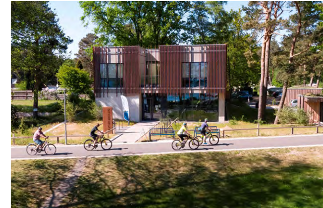
Links: Die ökologische Schutzstation in Winzlar; oben: Das Naturparkhaus