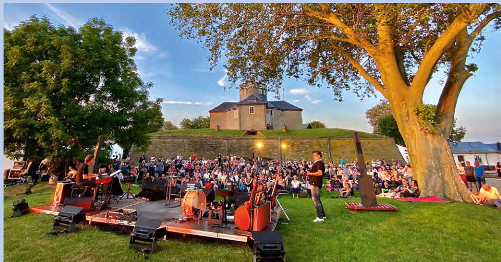
Kulturelle Highlights auf Insel Wilhelmstein

Einmal jährlich im August verwandeln sich die Orte Steinhude und Mardorf zu einem maritimen Festplatz. Das Festliche Wochenende mit großem Höhenfeuerwerk, tausenden beleuchteten Booten auf dem Steinhuder Meer und Musik auf 5 Bühnen verzaubert die Gäste jedes Jahr auf Neue.