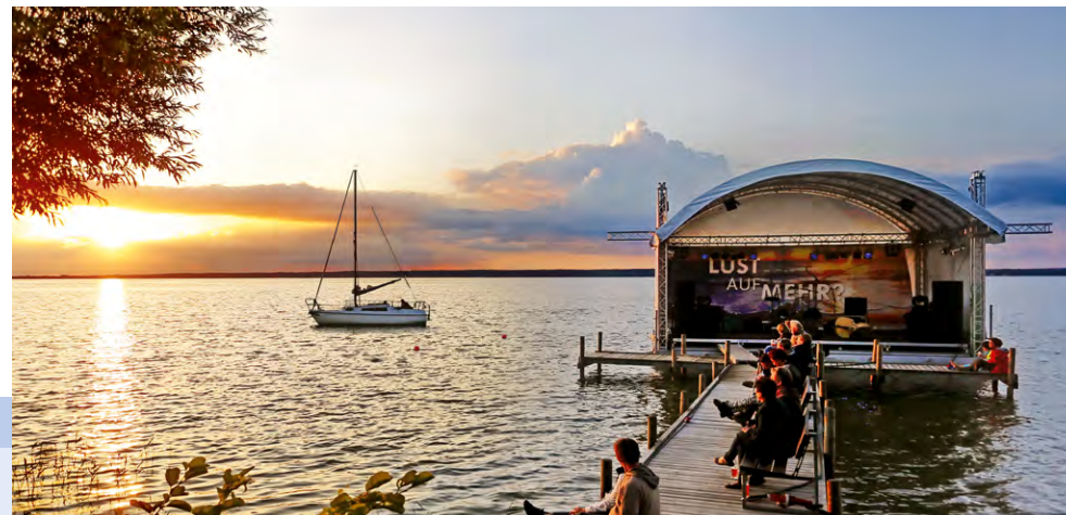
Die Steinhuder Meer Seebühne