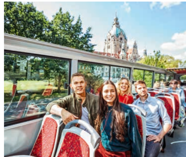
Doppeldecker-Bus am Neuen Rathaus | Double-decker bus at the New Town Hall