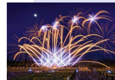
links: Int. Feuerwerkswettbewerb Herrenhäuser Gärten, rechts: Paddeln auf der Ihme