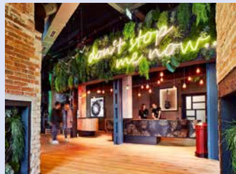
oben: DoubleTree by Hilton Hannover Schweizerhof, unten links: Courtyard Hannover Maschsee, unten rechts: Me And All Hotel Hannover