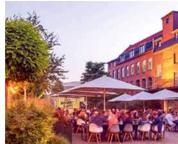
links: Helmkehof, rechts: Eisenwerk 15/2