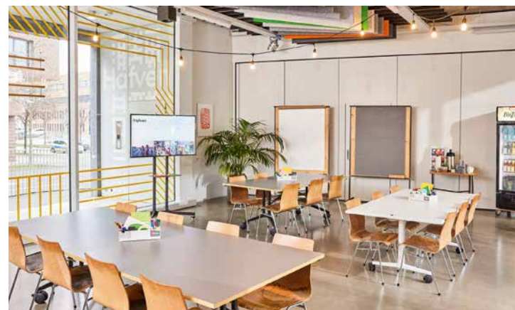
oben links: Galerie Herrenhausen, oben rechts: Hannover Congress Centrum (HCC), unten: Hafven