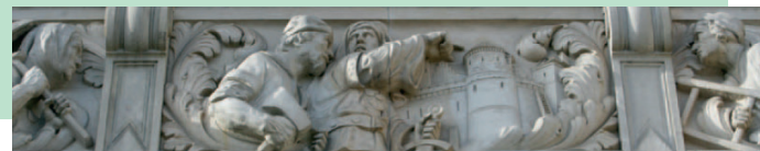
Historischer Fries · historical frieze · frise historique

🇫🇷 Majestueux : construit entre 1901 et 1913 dans le style historicisme - Solide : construit sur 6.026 pieux en bois de hêtre - Impressionnant : le bâtiment a une longueur de 129 mètres, une largeur de 67 mètres et une hauteur de 98 mètres - Unique : on accède au sommet de la coupole grâce à un ascenseur incliné à 17° - Populaire : plus de 100.000 visiteurs montent chaque année au sommet de la coupole - Important : la grande salle centrale a une longueur de 30 mètres, une largeur de 21 mètres et une hauteur de plus de 30 mètres - Empreint d'histoire : quatre maquettes représentent l'histoire de Hanovre de 1689 à nos jours - Déterminé : le tireur à l'arc sur la place Trammplatz vise directement le bureau du maire - Spacieux : 300 bureaux et 12 salles de réunion représentent une surface utile de 8.700 m 2