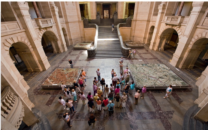
Haupthalle · main hall · salle centrale

Die Spitze des Rathaussturmes erreicht eine Höhe von 97,73 m. Einmalig für die deutsche Rathausarchitektur sind das Kuppeldach sowie der darin in einer Neigung von 17 Grad verlaufende Bogenaufzug. Mit diesem europaweit einzigartigen Aufzug gelangen die Besucher auf die oberhalb der Kuppel gelegenen Aussichtsplattformen. Der Aufzug verfügt neben Fenstern im Kabinendach auch über solche im Kabinenboden. Letztere können auf Wunsch jedoch undurchsichtig gestellt werden.