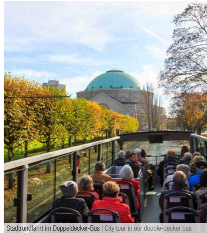
Stadtrundfahrt im Doppeldecker-Bus | City tour in our double-decker bus

Fahrzeiten können abweichen, Vorschriften sind möglich! Aktuelle Informationen unter www.visit-hannover.com/stadttouren oder Tel.: +49 511 12345-111