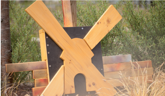
Geocaching - moderne Schnitzeljagd · modern-day treasure hunt