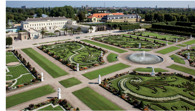
Herrenhäuser Gärten · Royal Gardens of Herrenhausen