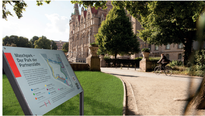
Park der Partnerstädte · Twin Towns' Park

The caches, hidden in places that link the city and surrounding region with the whole world, have a distinctly international flavour: examples are Hannover's international airport, the world's largest exhibition centre and the Herrenhausen Gardens, which every year form the backdrop to the International Fireworks Competition. That's all we're revealing – for now!