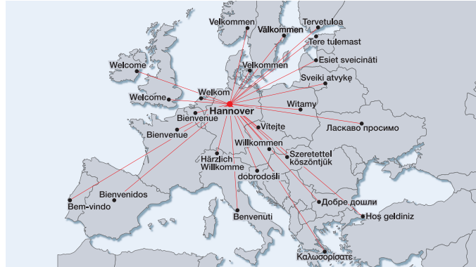
In der Mitte Europas · in the centre of Europe

Find out more at: www.hannover.de/geoheimnisse and www.geocaching.com