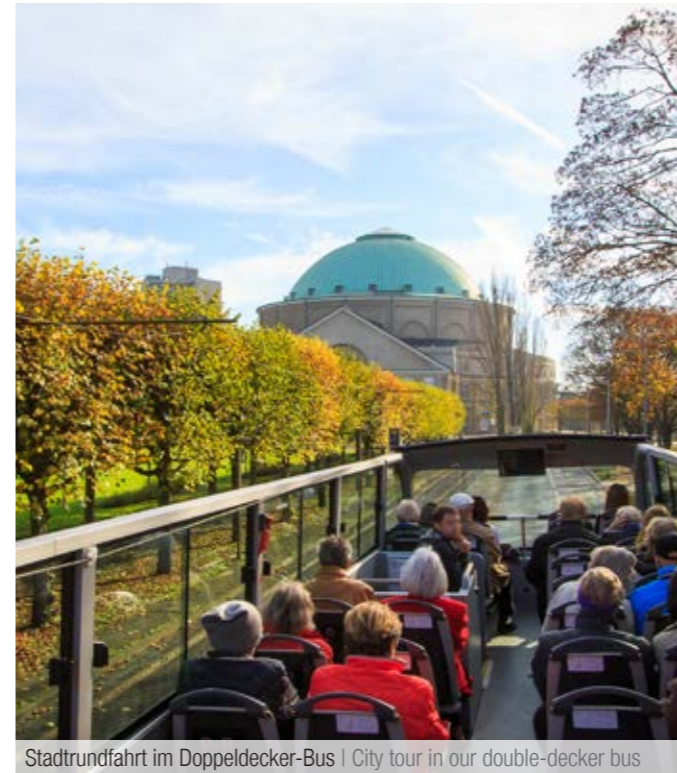
Stadtrundfahrt im Doppeldecker-Bus | City tour in our double-decker bus

Fahrzeiten können abweichen, Vorschriften sind möglich! Aktuelle Informationen unter www.visit-hannover.com/stadttouren oder Tel.: +49 511 12345-111