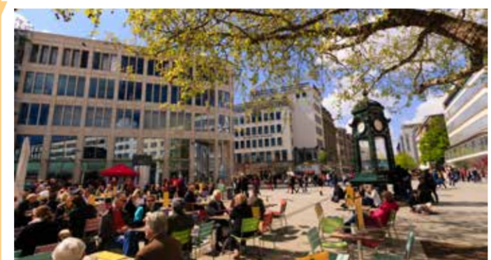
Cafés am Kröpcke

Willkommen in der Landeshauptstadt Hannover! Vor dem Bahnhofsgebäude reitet König Ernst August (Regierungszeit 1837 bis 1851). Das Denkmal erinnert daran, dass Hannover bis 1866 Hauptstadt des gleichnamigen Königreichs war.