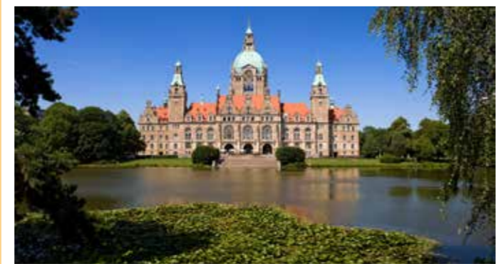
Neues Rathaus mit Maschteich

Der monumentale 97 Meter hohe Kuppelbau wurde auf genau 6.026 Buchenpfählen errichtet und 1913 fertiggestellt. Die Fahrt mit dem Bogenaufzug auf die Aussichtsplattform wird mit einem Panoramablick belohnt. Auf der Südseite befindet sich der Maschpark mit Maschteich, im Norden das Museum August Kestner mit Sammlungen von Ägypten bis Gegenwart.