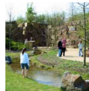
Park der Sinne

Luft, Wasser, Feuer, Erde: Vier Elemente zum Sehen, Hören, Fühlen, Schmecken und Riechen sorgen im Park der Sinne in Laatzen auch nach der EXPO für sinnliche Vielfalt und spannende Eindrücke. Den Besucher des Parks erwarten viele beeindruckende Naturhighlights zum Staunen, Anfassen und Genießen.