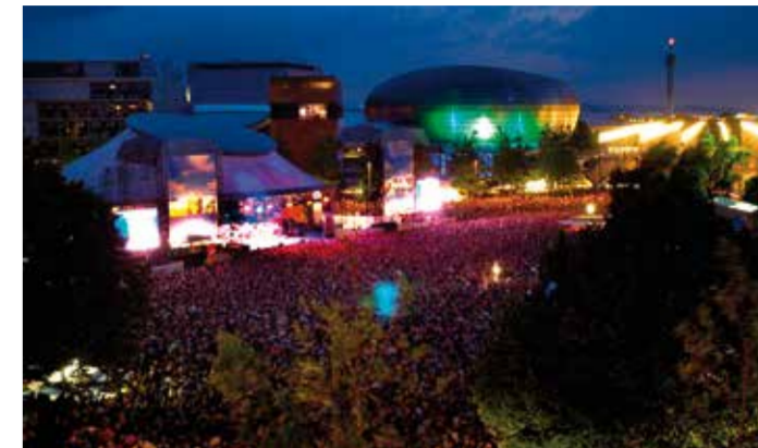
EXPO Plaza Festival im Sommer

„La Ola“ (die Welle) wird das kühne Dach genannt, das den Komplex der FinanzIT überspannt. Rechts daneben sehen Sie den ökologischen Vorzeigestadtteil Kronsberg mit inzwischen knapp 7.000 Einwohnern.