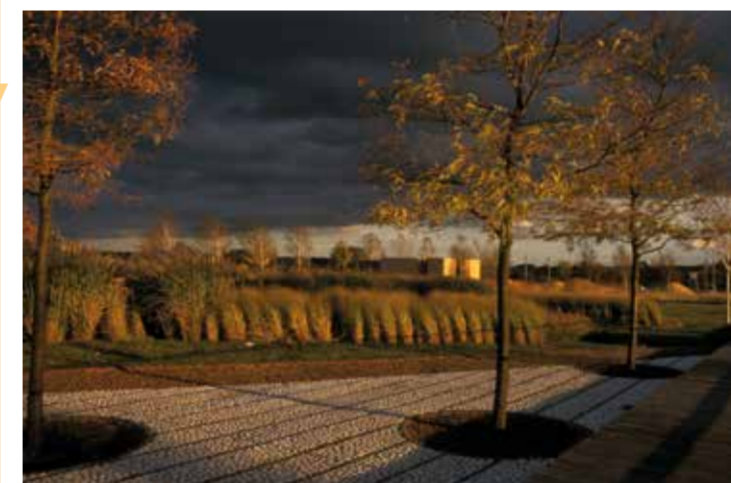
Abendstimmung in den „Gärten im Wandel“